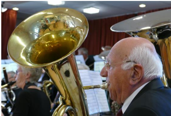
Optreden Gewestelijk Senioren Orkest