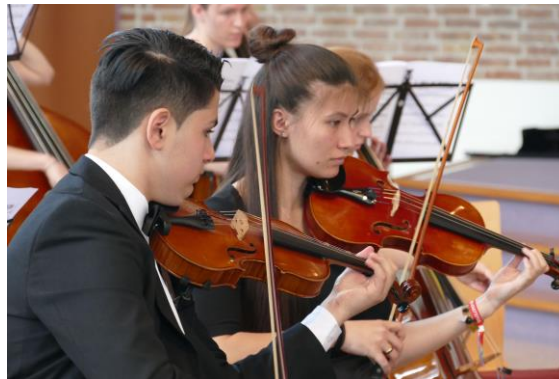
Viotta Jeugdorkest tijdens Slotconcert Week van de Cultuur