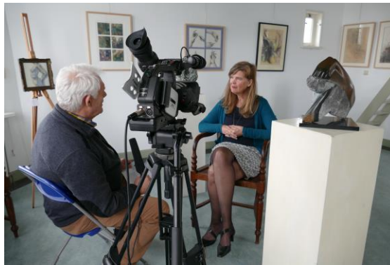
Interview RITV in Douanehuisje