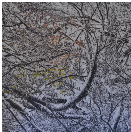
Werk van Renate van Opdorp

In juni 2015 heeft Pim van Halem in het Douanehuisje geëxposeerd, hij heeft een maandlang dagelijks gewerkt aan het project Twaalf Panorama's van het havengebied (met Maassluis en Douanehuisje) in Oost-Indische inkt. Daarna heeft hij de tekeningen met vloeibare acryl ingekleurd en constructies gemaakt om het papier vrij in de ruimte te kunnen plaatsen. Het resultaat was van 25 september tot 20 november 2016 te bewonderen in het museum.