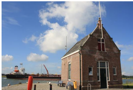
A house with a view