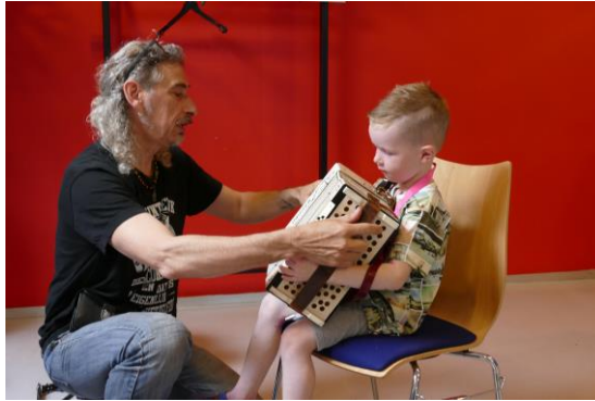
Open les Muziek@Maassluis

In de Week van de Cultuur 2017 zal daarom meer gefocust worden op bepaalde activiteiten.